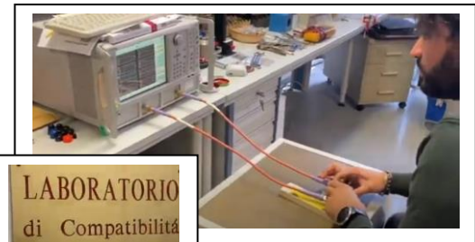
LABORATORIO di Compatibilità ELETTROMAGNETICA